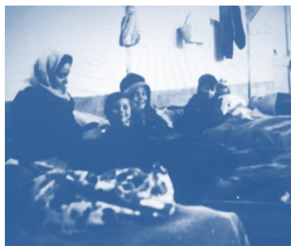
Camp de Gurs 1942